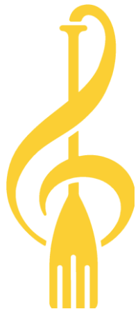
TABLE VIP - 5 800 $ - (Uniquement le samedi soir)